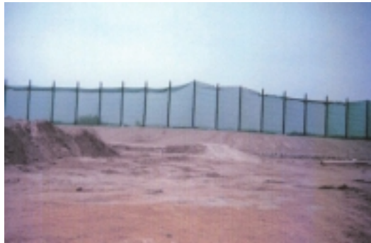
Abbildung 1: Fangnetze einer Trap/Skeet-Anlage [VOSS, J. H.]

Fangnetze (siehe Abbildung 1) führen zu einer Reduzierung der Schrotbereiche. Fangnetze lassen sich z. T. beweglich errichten (max. 20 m Höhe), so dass die hohen Netze nicht ständig das Landschaftsbild beeinträchtigen. Dies kann bei einem Genehmigungsverfahren u. U. als Vorteil gesehen werden. Die Kunststoffnetze müssen allerdings in bestimmten Mindestabständen von den Schützenständen errichtet werden, da sonst die Schrote die Netze durchschlagen und somit die Schrote durch die beschädigten Netze nur mehr teilweise zurückgehalten werden. Außerdem unterliegen die Netze durch den Einfluss des UV-Lichts einem Alterungsprozess, der einen regelmäßigen (kostenintensiven) Austausch der Netze notwendig macht.