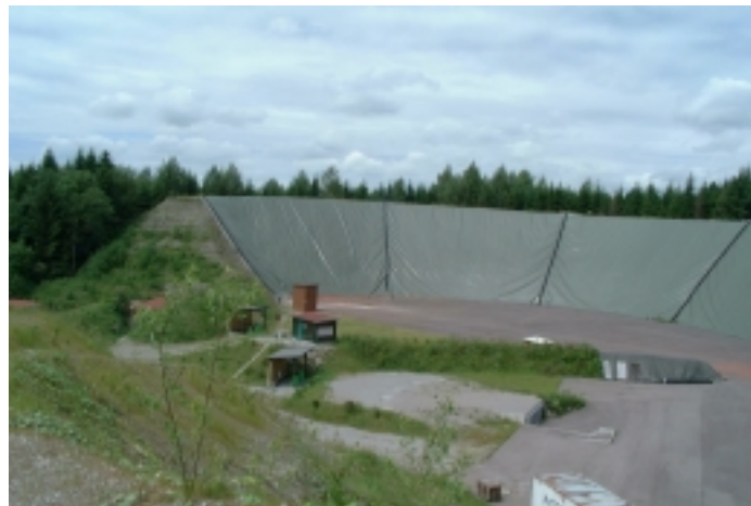
Abbildung 4: Wallanlage mit Folienabdeckung

Weiterhin wird derzeit erprobt, einen vorhandenen oder neu angelegten Wall mit Folie abzudecken (siehe Abbildung 4) und evtl. mit einer senkrecht zur Böschungsfläche angeordneten Abprallwand zu versehen. Dies bietet den Vorteil, dass sich Schrote und Wurfscheibenscherben am Grund der Anlage sammeln und bei entsprechender Befestigung der Grundfläche problemlos eingesammelt und auch getrennt werden können. Ein Eintrag von Blei und PAK in den Boden kann bei fachgerechter Ausführung nicht erfolgen. Bei Folie und Prallwänden besteht unter Umständen die Gefahr, dass Schrote als Rück- oder Abpraller die Schützen gefährden oder die Wurfscheibenschießanlage verlassen.