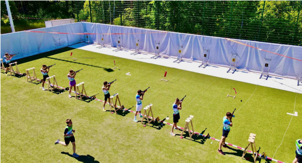
Schießstand während des Wettkampfes. Bild: DSB Target Sprint Trophy 2023 über Drohne