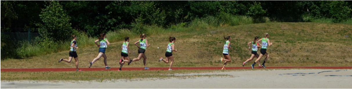
Schneller Rundkurs auf 400m Tartanbahn.