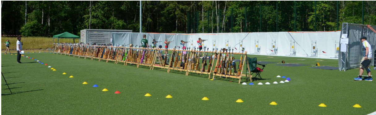
Moderner mobiler Schießstand. Bild: SoBi Regionalqualifikation NORD 2023