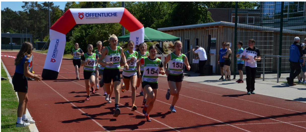
Start der Juniorinnen.