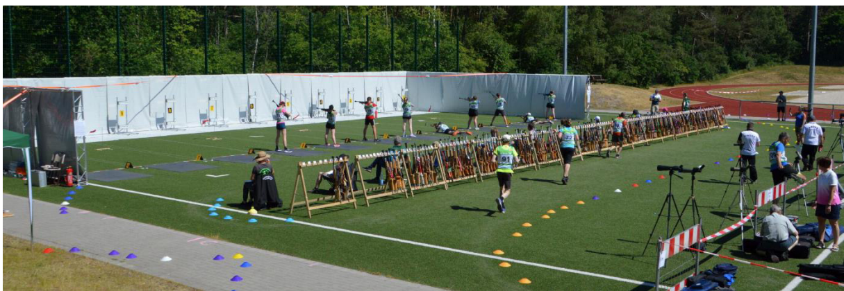
Der Schießstand während des Wettkampfes. Bild: SoBi Regionalqualifikation NORD 2023.