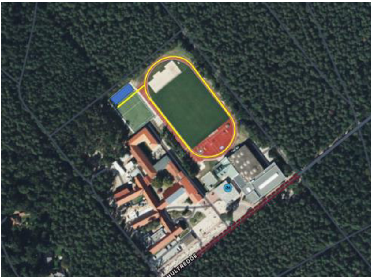
Luftaufnahme der Anlage mit Schießstand und Laufstrecke.